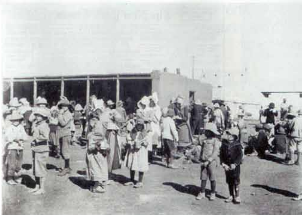
Estudos mostram que 80% das crianças que recordam de vidas passadas, com memória de mortes violentas, como as relatadas historicamente em Campos de Concentração (foto), apresentam sintomas de TEPT

Em resposta à necessidade de integração coerente entre o sistema de crença reencarnacionista e a psicoterapia, publiquei em periódico indexado o primeiro artigo científico sobre o tema. A repercussão significativa entre os colegas psicólogos estadunidenses, europeus e asiáticos foi demonstrada nos numerosos e-mails com pedidos de curso sobre reencarnação e psicoterapia, o que me motivou a estruturar o primeiro deles no Brasil – presencial ou à distância – a iniciar em 7 de agosto de 2012 (veja www.reencarnacaoepsicoterapia.com.br ). Além de apresentar métodos/manejos terapêuticos coerentes para abordar eticamente os pacientes reencarnacionistas, responderemos a perguntas como: Quais são os limites dos psicólogos quando os temas religiosos/espirituais envolvem a queixa do paciente? Quais os diferenciais entre o trabalho psicoterapêutico realizado apenas por psicólogos e as atividades de capelães, religiosos e orientadores espirituais?