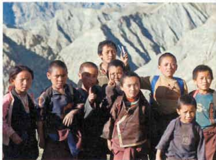
A reencarnação desempenhou papel ativo no desenvolvimento de mecanismos de enfrentamento por refugiados tibetanos

Portanto, a psicoterapia deve se voltar para os pacientes e respectivos sistemas de crenças no sentido de potencializar