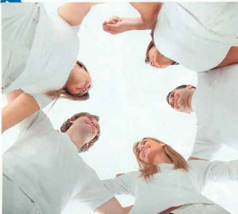
No mundo inteiro, um grande número de pessoas crê na reencarnação, tema que deve ser abordado na psicoterapia

maior parte da população mundial ( World Values Survey ).