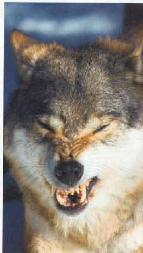
PL., de 23 anos, obteve explicação e alívio de um pesadelo recorrente, que mostrava o ataque de um lobo feroz

O psicólogo me pediu para ir falando livremente sobre o pesadelo. Fechei meus olhos e, então, eu me vi como uma criança dormindo em uma casa de madeira na neve. Acordei sentindo frio e vi que um lobo enorme olhava para mim através da porta aberta. Foi uma morte traumática, senti angústia terrível por morrer sozinho! Entendi que a impotência, a ansiedade e o desamparo pertenciam ao passado e que agora estou vivendo em um contexto diferente, sou um adulto forte e apoiado pela minha família. Os pesadelos acabaram e consegui desligar do trauma e viver no presente em paz."